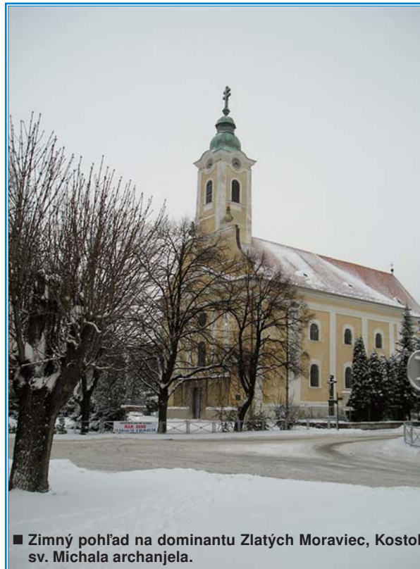
■ Zimný pohľad na dominantu Zlatých Moraviec, Kostol sv. Michala archanjela.