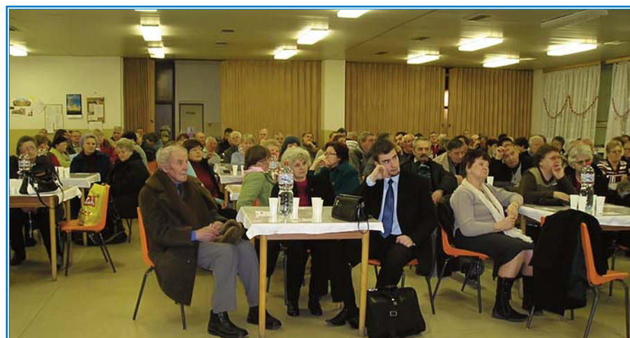
A. Mondočková foto: autor

Konkurz je určený pre deti od 5 do 12 rokov, ktoré vynikajú v tanci, speve, hre na hudobnom nástroji. Vybraní účastníci konkurzu sa predstavia širokej verejnosti v Gala mini talent show v MsKS 11. apríla. Písomné prihlášky zasielajte do 8. 3. na adresu: Mestské kultúrne stredisko, Námestie A. Hlinku 1, 953 28 Zlaté Moravce, alebo emailom peter.keres@atlas.sk . Viac informácií na t. č.: 037/6423277, 6426422.