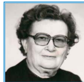
Dcéra, syn, vnučatá a právnučatá 9/036/2010/DZ

Kto ste ju poznali, venujte jej tichú spomienku.