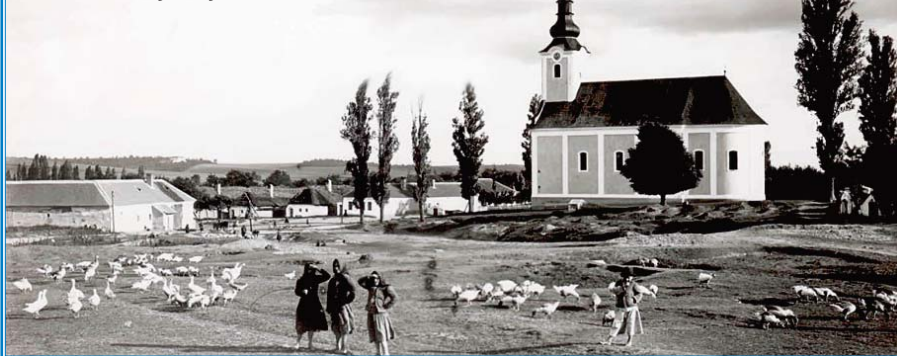
■ Tesárske Mlyňany 1886, kostol

maždenia sa nekonali v stoličnom sídle, ale na viacerých miestach napr. v r. 1594 v Tesároch.