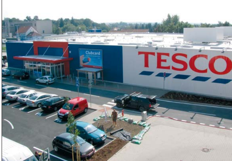
■ TESCO Zlaté Moravce