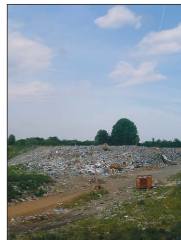
■ Skládka odpadu

nariadenia mesta o miestnom poplatku za komunálny odpad a drobný stavebný odpad občania