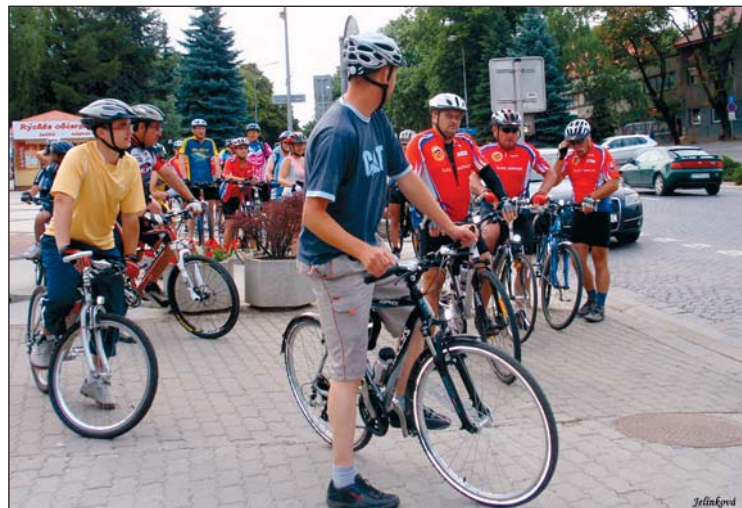
■ Účastníci Cyklokola na Námestí A. Hlinku v ZM.

trasa viedla Cigánskou dolinou a od rázcestia s Malou Lehotou sa napájala na prvý okruh do Veľkej Lehoty. Záver podujatia patrilo pohosteniu pri guláši, tombole a